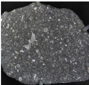
Une coupe de la célèbre météorite d'Allende, une chondrite carbonée.