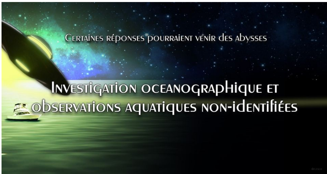
Figure - Bannière réalisée par Alex Esco pour notre site web et groupe Facebook